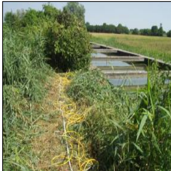
Fig. 2 Area di passaggio tra il canale in terra e la struttura in cemento, stendimento degli elettrodi per la realizzazione dell'esperimento.