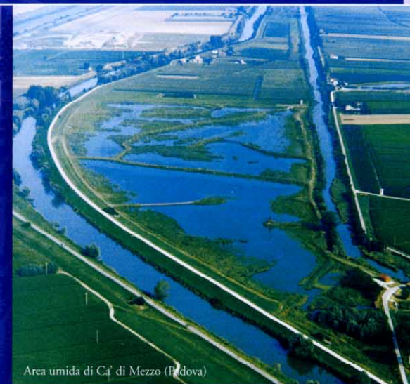
Area umida di Ca' di Mezzo (Padova)